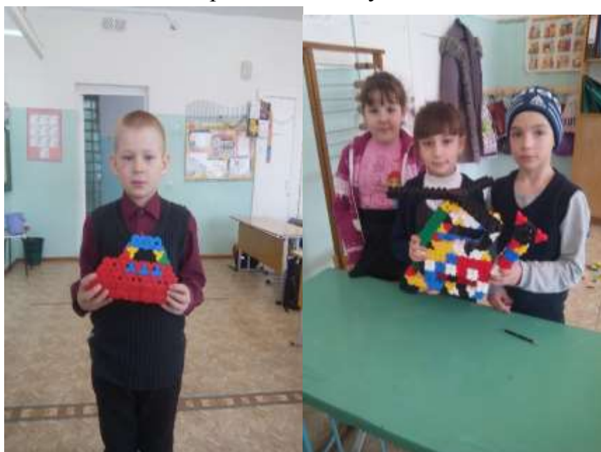
фото1. Кожин И. Утюг

На острове Трансформеров школьники показали свои умения работать с конструктором. Очень интересные работы показали учащиеся 3 класса. Фантазия у детей оказалась огромная. Все с удовольствием конструировали!